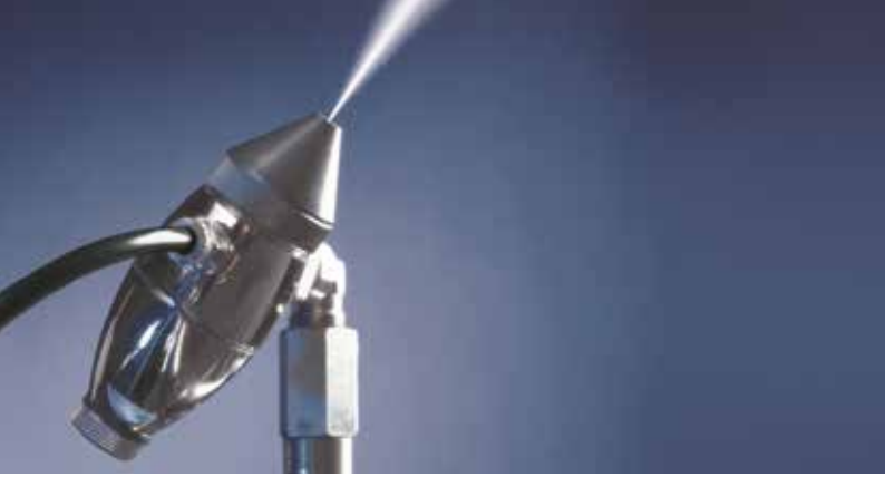
JetSpray basınçlı hava ve su ile nemlendirme

TESİSİNİZ İÇİN ÜCRETSİZ DANIŞMANLIK İSTEYİN