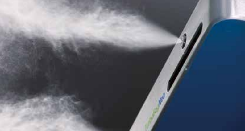
Draabe TurboFogNeo yüksek basınçlı nemlendirici