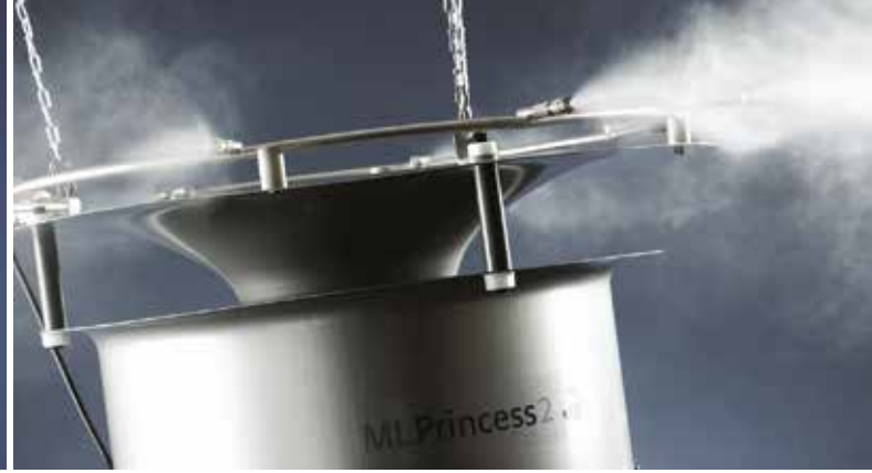
ML Princess yüksek basınçlı nemlendirici