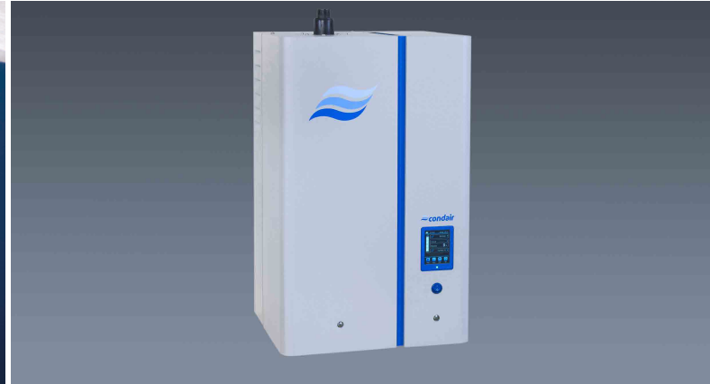
Condair EL buharlı nemlendirici

Condair Nemlendirme A.Ş. Mahmutbey Mh. Taşocağı Yolu Cd. Ağaoğlu My office 212 No:3 D:32 Güneşli-Bağcılar/Istanbul Tel: + (90) 212 803 34 25 – COTR-info@condair.com - www.condair.com.tr