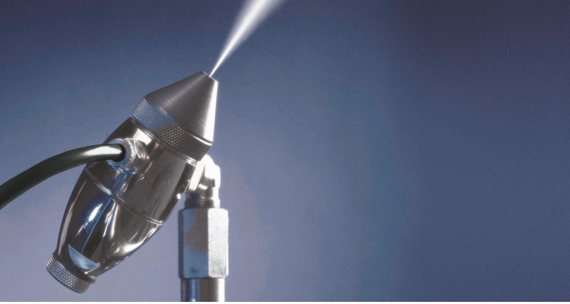
Atomizer (spray) nemlendirici

Condair müşterilerine nemlendirme cihazlarına ek olarak, su arıtma sistemleri, hava kompresörleri, pompa ve nem takibi gibi geniş bir ürün yelpazesi sunuyor.