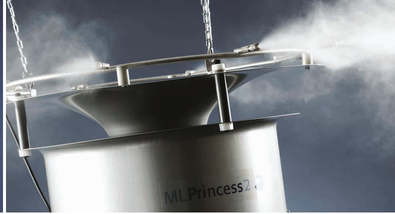
ML Princess yüksek basınçlı nemlendirici